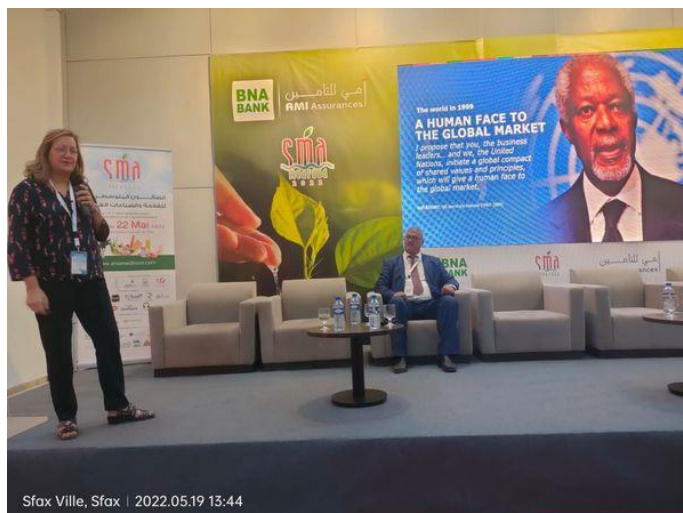
Sfax Ville, Sfax | 2022.05.19 13:44

L'Institut de Responsabilité Sociétale des Entreprises en Tunisie « IRSET » prend part à la deuxième séance à travers une présentation sur « L'agriculture durable : état des lieux et perspectives de développement »